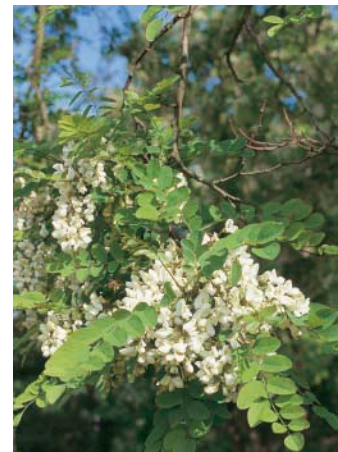
Fiederblatt und Blüten der Robinie

drängt wird, scheint sie bei uns dauerhafte Bestände auszubilden.